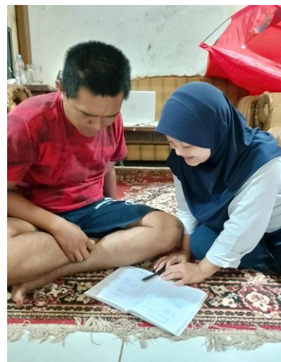
Gambar 2. Proses wawancara tim Sekolah Tinggi Ilmu Ekonomi Pada Pelaku Usaha

Setelah melakukan wawancara, diperoleh bahwa para pelaku UMKM masih kesulitan dalam penyusunan laporan keuangan. Beberapa UMKM tidak mencatatkan pengelolaan dana usahanya sesuai dengan kaidah akuntansi, sehingga sering terjadi pencampuran hasil usaha dengan kebutuhan hidup sehari-hari. Para pelaku usaha kesulitan menentukan secara tepat berapa pendapatan yang diterima, berapa biaya operasional yang harus dikeluarkan hingga berapa keuntungan yang diperoleh. Pencatatan yang dilakukan umumnya tidaklah sesuai standar. Pencatatan dilakukan hanyalah sebatas pengingat.